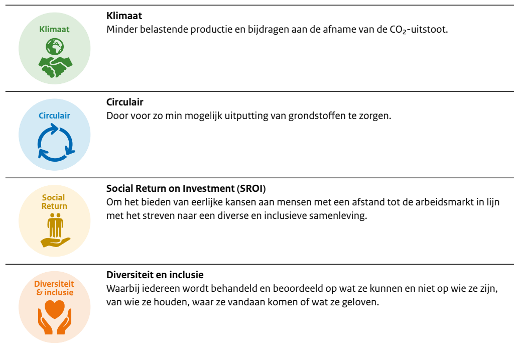
Tabel 3.1 De uitgewerkte thema's

Naast de thema's uit het manifest omarmt JenV ook het thema Nationale Veiligheid . Dit thema komt voort uit de beleidsverantwoordelijkheid van dit ministerie, vandaar dat JenV een leidende en strategische rol hierin wil nemen. Bovendien zijn er bij overheidsopdrachten veiligheidsbelangen en is het van belang dat de vitale infrastructuur van de overheid beschermd blijft 2 . De relatie van dit thema met Inkoop en MVOI is relatief nieuw, dus de acties die JenV neemt zullen vooral verkennend zijn.