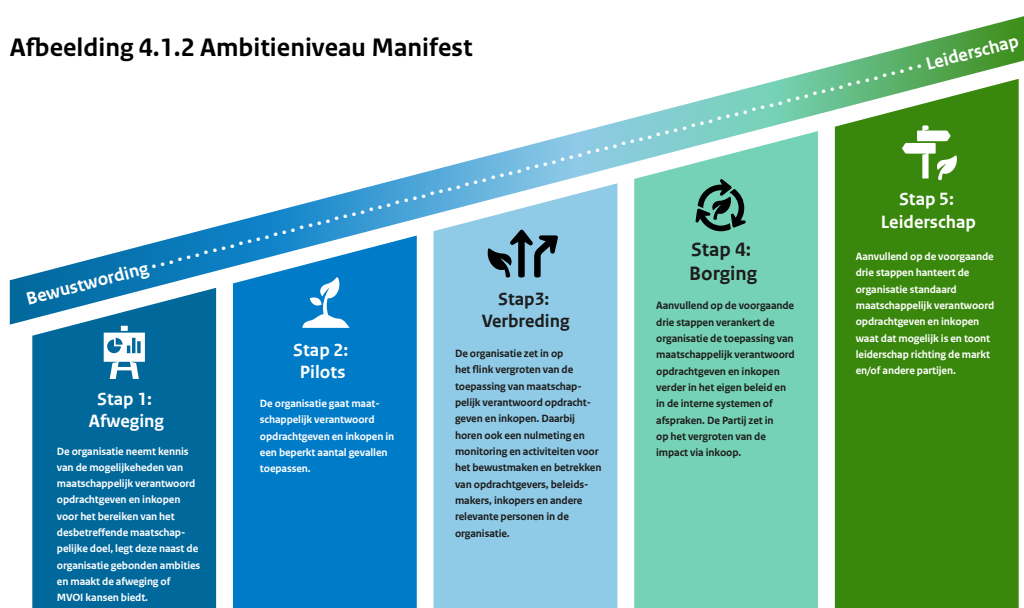
Afbeelding 4.1.2 Ambitieniveau Manifest