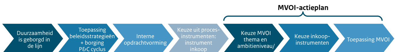
Figuur 2: van duurzame strategieën naar opdrachtgeverschap naar MVOI-toepassing

Hoe eerder duurzaamheid onderdeel uitmaakt van het interne opdrachtproces, hoe groter de kans dat de duurzame ambities gerealiseerd worden. Als de ambities goed in kaart zijn gebracht, hebben de opdrachtgevers en inkopers in de lagen daaronder meer houvast om deze ambities te concretiseren. Het MVOI-actieplan ziet toe op het 'staartje' van dit proces. Financieel-Economische Zaken (FEZ) onderzoekt daarom samen met het CDI-office of het mogelijk is om duurzaamheidsdoelen te borgen in de planning-en-controlcyclus (P&C-cyclus) en zo een structurele plek te geven in het interne opdrachtgeverschap. Vervolgens faciliteert de inkoopdiscipline de duurzame uitvraag met tijdige en adequate ondersteuning.