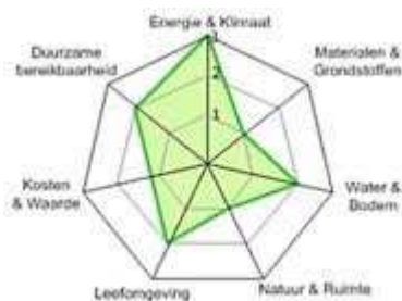
Voorbeeld van een ambitieweb.

Voor met name de grond- weg en waterbouw is een ambitieweb ontwikkeld, waarmee de uitwerking kan worden uitgevoerd. Het Rijk is bezig een tool te ontwikkelen om het ambitieweb te kunnen toepassen. Voor de grotere projecten gaan we deze tool inzetten.