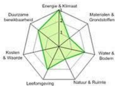
Voorbeeld van een ambitieweb.

Voor met name de grond- weg en waterbouw is een ambitieweb ontwikkeld, waarmee de uitwerking kan worden uitgevoerd. Het Rijk is bezig een tool te ontwikkelen om het ambitieweb te kunnen toepassen. Voor de grotere projecten gaan we deze tool inzetten.